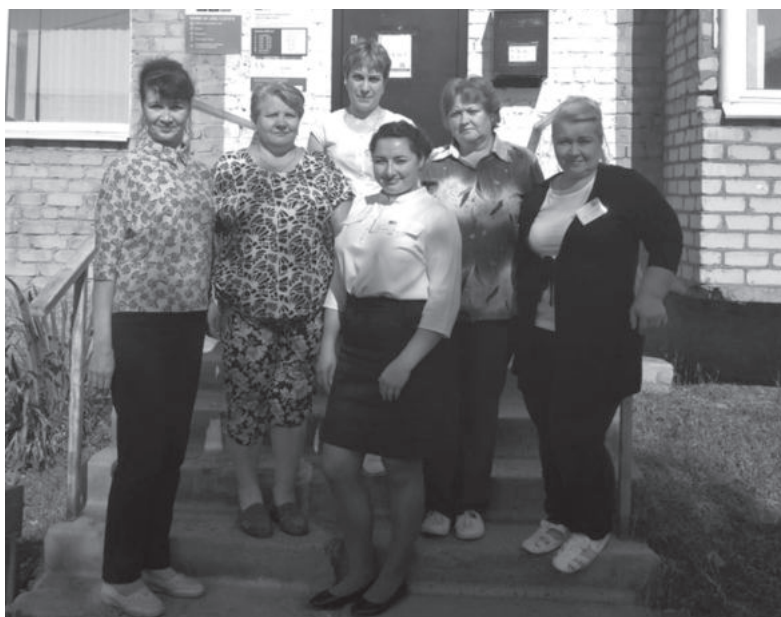
Сотрудники почтового отделения в п. Пионерском

Осинцевская территориальная администрация и совет ветеранов