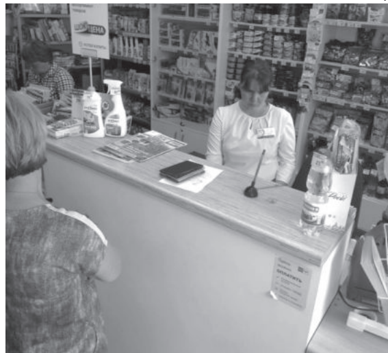
Почтовое отделение «Зайково-1»

В поселке Зайково функционирует сразу два отделения почты. В первом работники обслуживают только жителей поселка, во втором – частично клиентов поселка Зайкова и население деревень Мельниковой, Молоковой, Давыдковой. В Зайковском почтовом отделении работают начальник, оператор и три почтальона. В прошлом году за